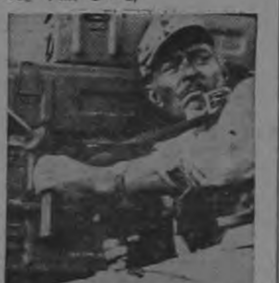
COMANDOS En colores.

El capítulo más sangriento de la guerra en el Desierto! Estos hombres no tenían ni el derecho de morir... pues del éxito de su misión dependía la suerte del mundo! Lee Van Cleef,