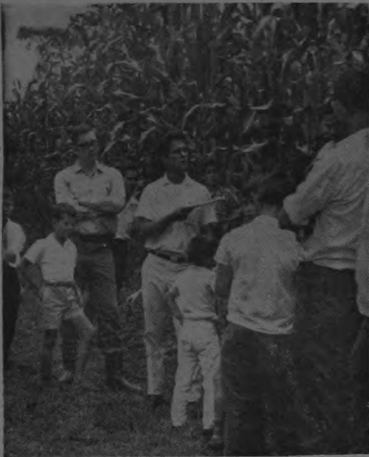
En puriscal, durante la temporada del concurso de producción de maíz, los Socios 4-S dan demostraciones y charlas a sus vecinos y compañeros.