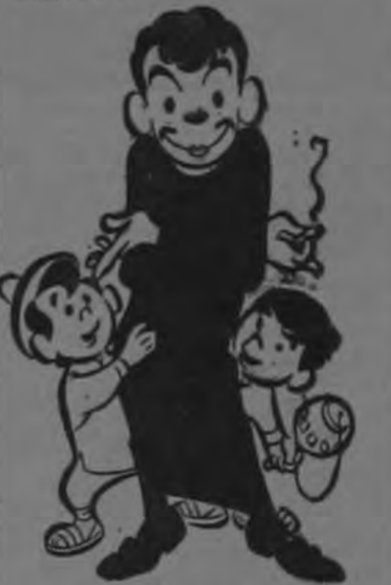
EL PADRECITO En Colores.

Otro simultáneo arrollador con la película entrela de CANTINFLAS