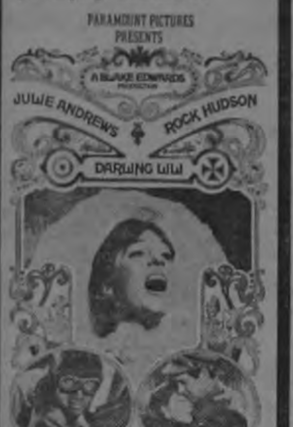
Lili mi adorable espía En colores.