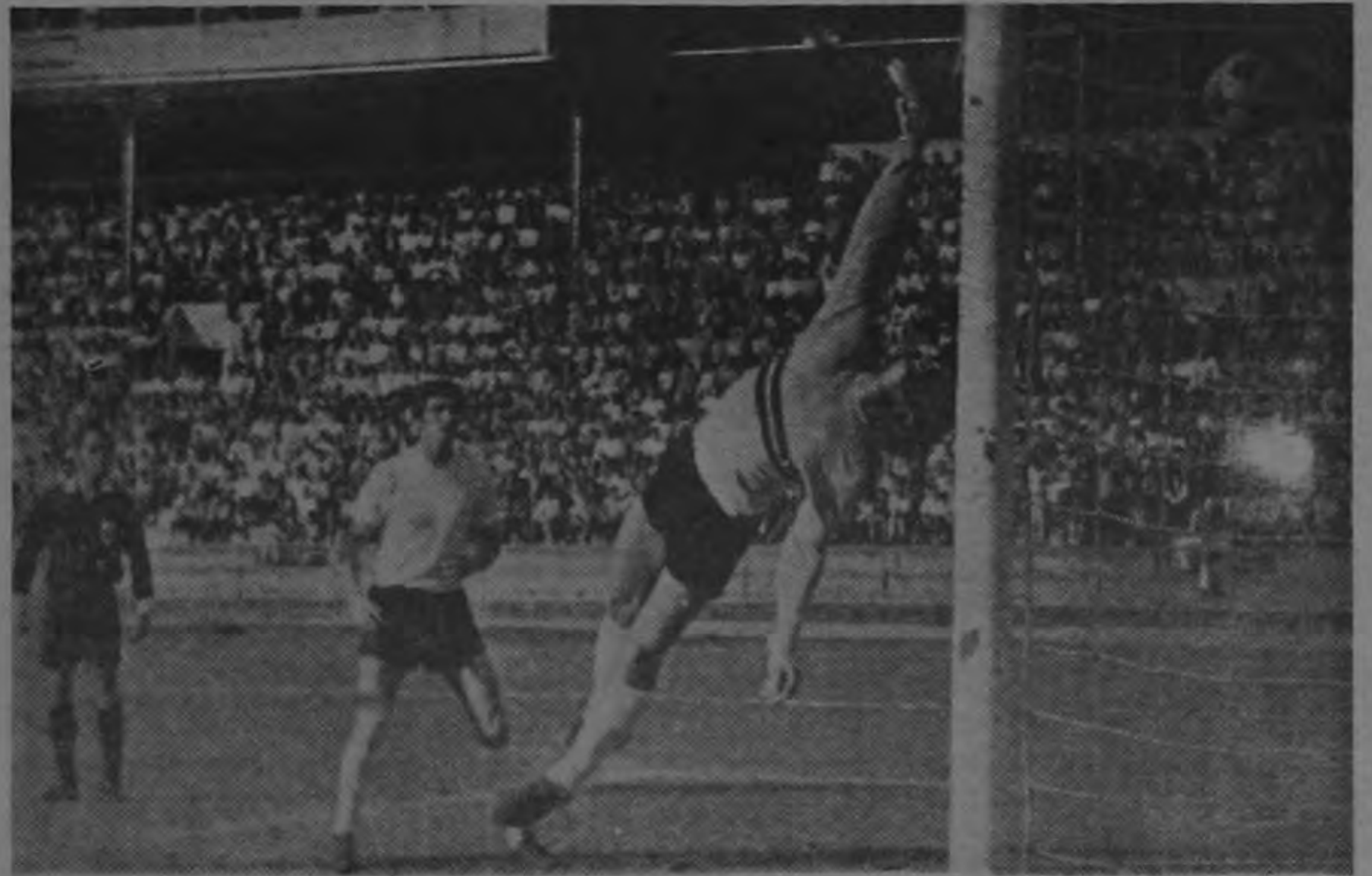
PRIMER GOL DEL PARTIDO: Se jugaban sólo cuatro minutos del primer tiempo cuando lograron los checoslovacos del Uda Dukla abrir el marcador. Un tiro libre desviado apenas por la defensa yugoslava del Ve-

La asistencia reportada como oficial fue de 8.405 personas que provocaron una taquilla de $ 69.971.00.