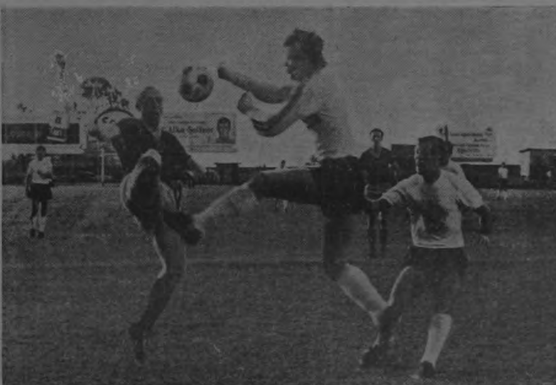
GELETA AL ATAQUE: El famoso veterano checoslovaco se fue al ataque después de que el marcador se puso en contra del Uda Dukla tratando de conseguir el empate. En esta jugada estuvo cerca de lograrlo pero

vich para rematar bajo y fuerte dejando sin chance al arquero checoslovaco Viktor. El tres por dos se sostuvo durante los quince minutos restantes del encuentro.