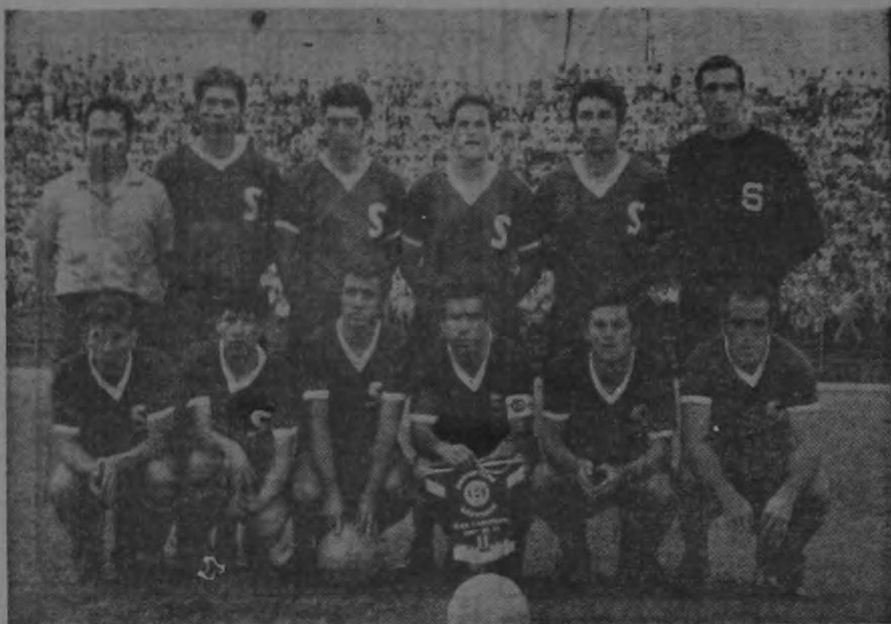
SAPRIISA vs. VELEZ MOSTAR: Hoy a las tres y media de la tarde se jugará el cuarto partido de la cuadrangular internacional de fútbol que auspicia la Federación Nacional de Fútbol. Esta vez será el magnífico equipo yugoslavo el que se enfrenta

El Santa Fe concluyó la serie extra en forma invicta, pero registró cinco empates. El Cali y Junior obtuvieron dos triunfos y tres empates y un fracaso cada uno. Cúcuta tres empates y tres derrotas.