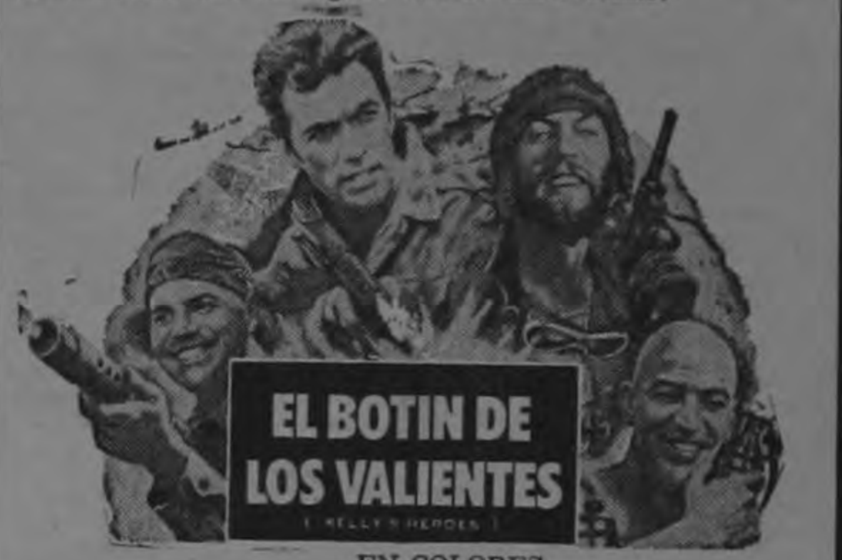
EL BOTIN DE LOS VALIENTES EN COLORES

TERCERA SEMANA DE RUIDOSO EXITO!! Jamás una aventura fue más arriesgada ni más emocionante!