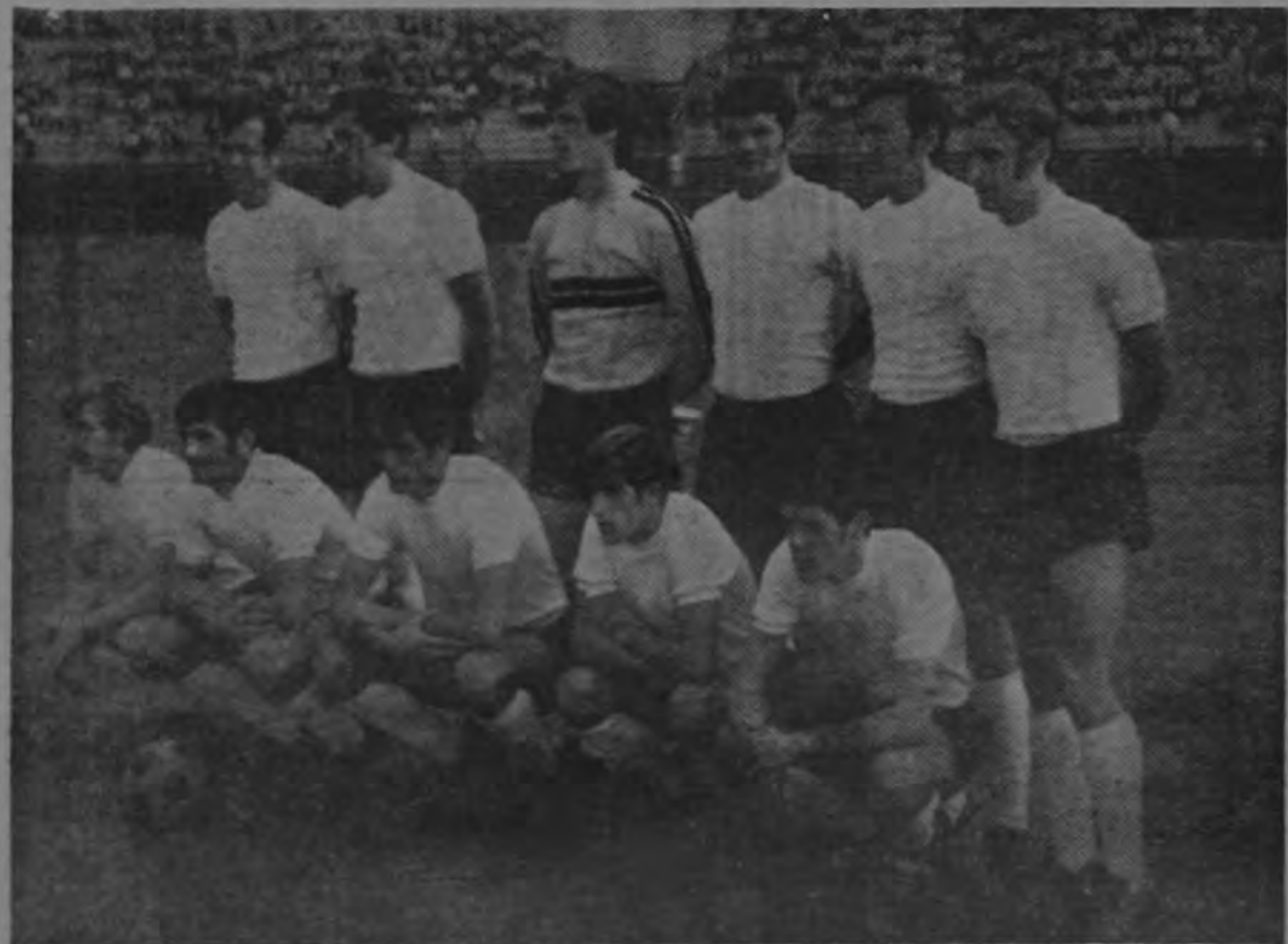
VELEZ MOSTAR: El magnífico equipo yugoslavo que con tanto éxito debutó el viernes derrotando al Uda Dukla de Checoslovaquia con marcador de tres goles contra dos. Ratificó plenamente por qué es el sub-

al conjunto local Deportivo Sapriisa. Por el estilo de juego muy parecido de unos y otros se espera un sensacional evento que provocará un lleno del estadio capitalino. El vencedor de este partido se colocará como líder absoluto del torneo.