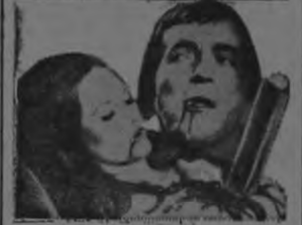
Sombras en la oscuridad En colores.

Barnabas Collins, Vampire, takes a bride in a bizarre act of unnatural love.